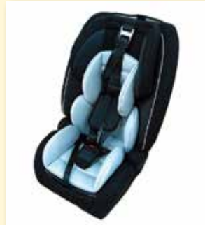
チャイルドシート

皆さまに気持ちよく使っていただくため、返却の際にはクリーニングをお願いしています。