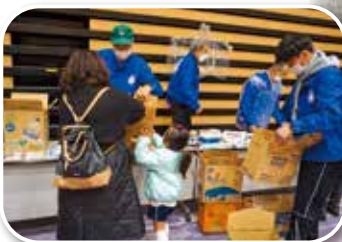
作ってみよう！ 段ボールトイレ