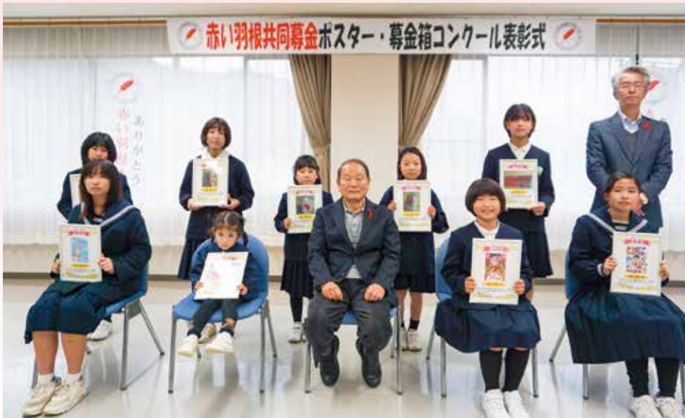
表彰式（令和5年12月16日 井原市芳井生涯学習センターで開催）

市内の幼稚園児・小・中学生を対象にポスターと募金箱の募集をしたところ、121点の応募をいただきました。ありがとうございます。選考の結果は次のとおりです。