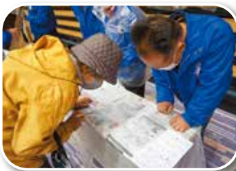
ごみ袋でレインコート