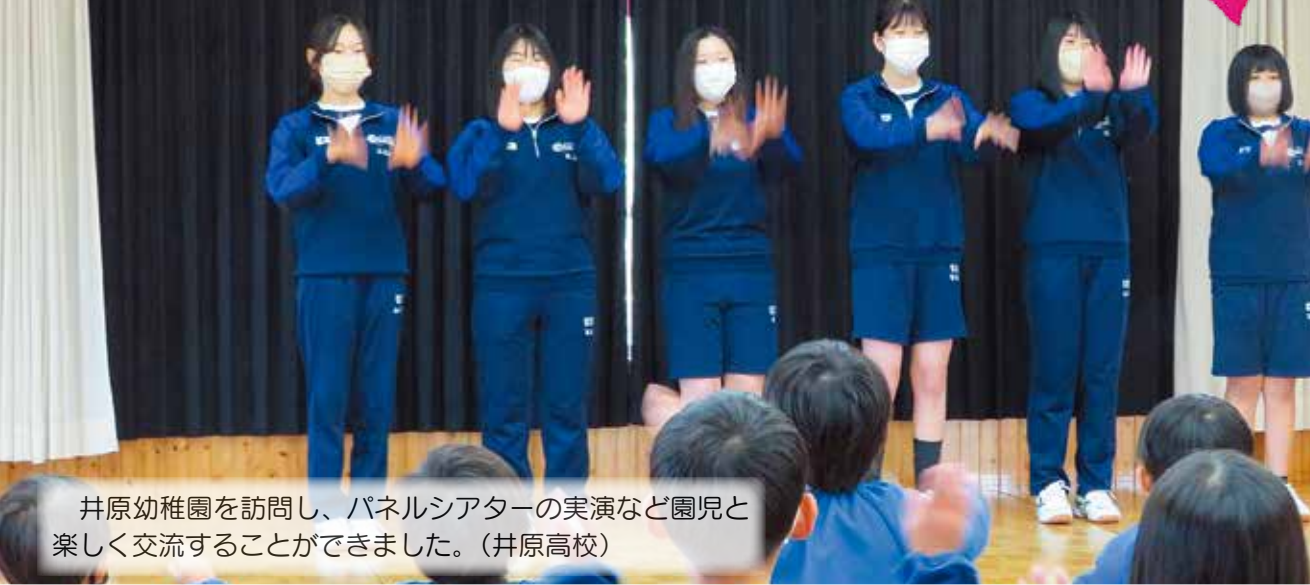
井原幼稚園を訪問し、パネルシアターの実演など園児と楽しく交流することができました。(井原高校)