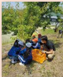
心を育む「ココイク」講座 木之子小5年生 梅干しづくり体験