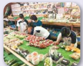
夏のボランティア体験事業