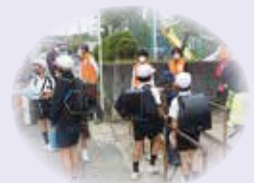
地区社会福祉協議会 登校のあいさつ運動