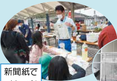
新聞紙でスリッパ!