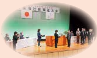
井原市社会福祉大会