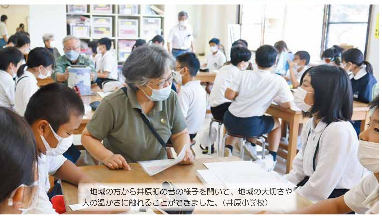
地域の方から井原町の昔の様子を聞いて、地域の大切さや人の温かさに触れることができました。(井原小学校)