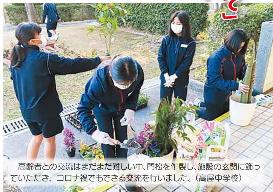
高齢者との交流はまだ難しい中、門松を作製し、施設の玄関に飾っていただき、コロナ禍でもできる交流を行いました。(高屋中学校)

「未来に向けて出会って関わってつながって」 「児童・生徒のボランティア活動普及事業」